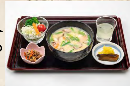
ごもく 五目 ぞうすいセット