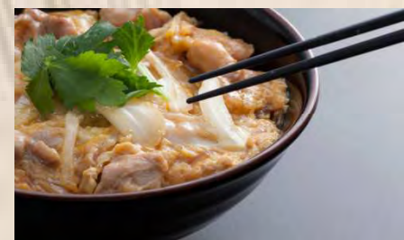
親子丼 (味噌汁・お新香付)