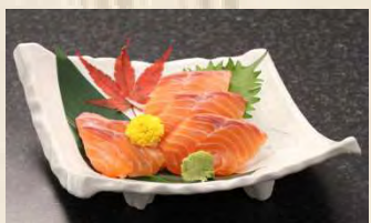
サーモンのお刺身 ?円