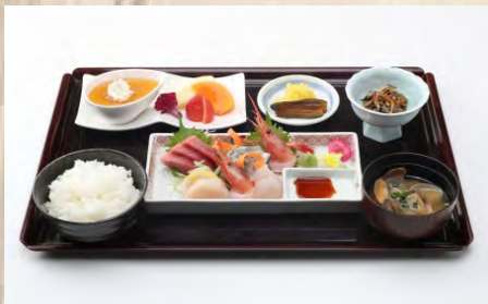
季節の お刺身定食