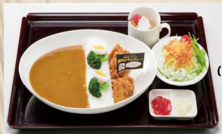
ごぜんやま 御前山 ダムカレーセット (日本ダムカレー協会認定)