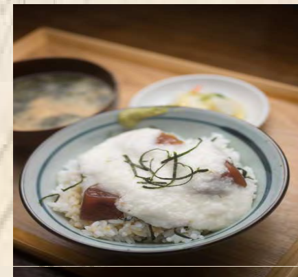
マグロ やまかけ定食