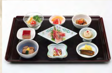
み 味かご御膳 (日替)