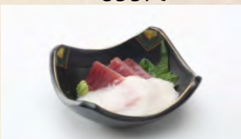
マグロの山かけ 600円