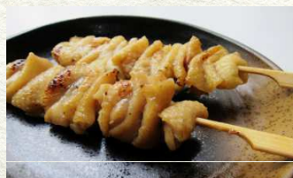
焼き鳥(皮・塩) 300円(2本)