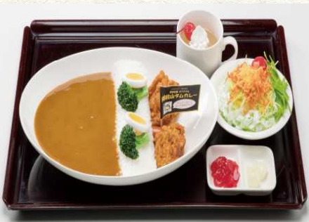
ごぜんやま 御前山 ダムカレーセット (ダムカレー協会認定)