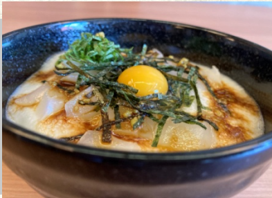
いか 鳥賊 とろろ丼