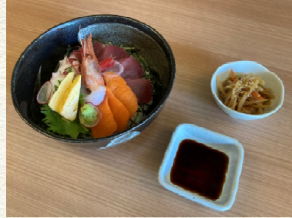
板長おまかせ 季節の海鮮丼