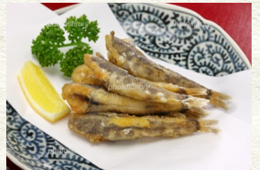
メヒカリの唐揚げ 500円