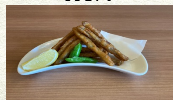
ごぼうスティック 550円