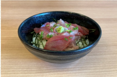
天然マグロの すき身丼