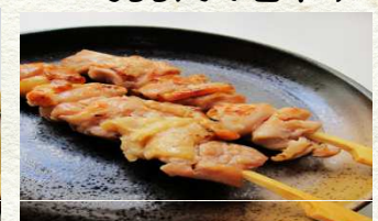
焼き鳥(もも・塩) 300円(2本)