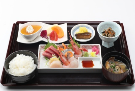
季節の お刺身定食