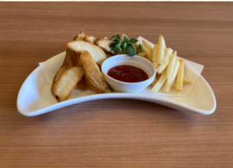
フライドポテト 500円