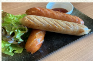
ソーセージ盛合せ 780円