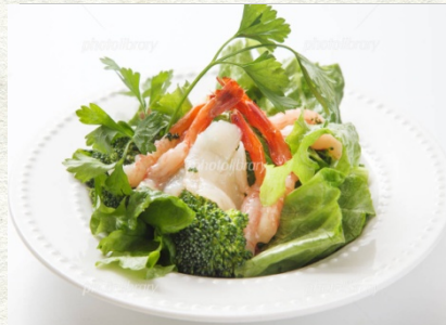
季節の 海鮮サラダ